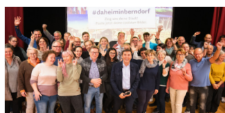
Gemeinsam zur neuen Marke: intensive Workshops und Stadtgespräche.

werbstaugliche Positionierung in drei Stärkefeldern entwickelt.