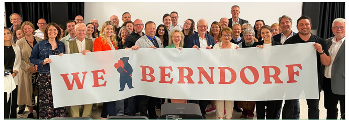
Erfolgreicher Markenlaunch: Am 15. Mai wurde die neue Marke Berndorf erstmals der Öffentlichkeit präsentiert.

Im Wettbewerb um Besucher*innen, Fachkräfte und Betriebe ist eine starke Marke die Basis für eine positive Entwicklung von Städten. Mit dieser Aufgabe sind wir vor knapp neun Monaten angetreten, um das Image unserer Stadt noch weiter zu schärfen und gemeinsam mit vielen Bürger*innen eine starke Marke Berndorf zu gestalten.