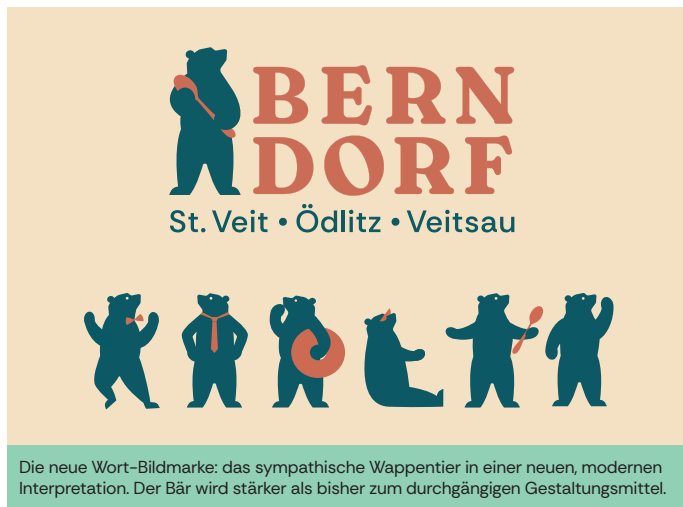
Die neue Wort-Bildmarke: das sympathische Wappentier in einer neuen, modernen Interpretation. Der Bär wird stärker als bisher zum durchgängigen Gestaltungsmittel.

Im Wettbewerb um Besucher*innen, Fachkräfte und Betriebe ist eine starke Marke die Basis für eine positive Entwicklung von Städten. Mit dieser Aufgabe sind wir vor knapp neun Monaten angetreten, um das Image unserer Stadt noch weiter zu schärfen und gemeinsam mit vielen Bürger*innen eine starke Marke Berndorf zu gestalten.